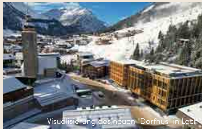
Visualisierung des neuen "Dorfhüs" in Lech